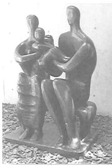
ファミリー・グループ ヘンリー・ムーア 作 箱根・彫刻の森美術館