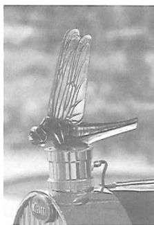
自動車の装飾・トンボ ルネ・ラリック 作 箱根ラリック美術館