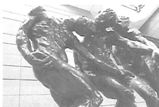
三つの影 オーギュスト・ロダン 作 茨城県近代美術館