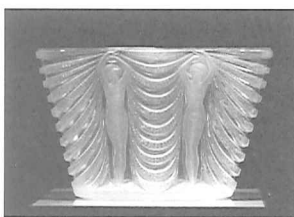
テルプシコール ルネ・ラリック 作 北澤美術館新館